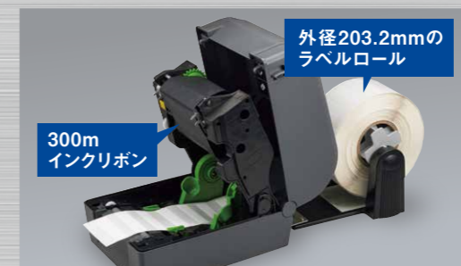
外付けロールホルダー装着後

さらに、オプションの外付けロールホルダー(PA-RH-001)を装着すれば、製造現場などでの大量発行用途にも適応します。また、紙管サイズの大きいRFIDラベルにも使用できます。