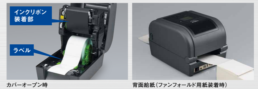
カバーオープン時

パネ式用の紙ガイドを搭載しているため、ラベルを簡単にセットできます。また、カバーが大きく開くため、インクリボンの交換もスムーズです。ファンフォールド用紙の背面給紙にも対応します。