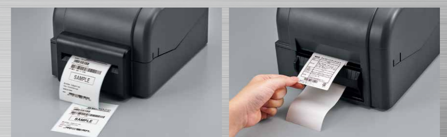
オートカッター搭載モデル

※TD-4750TNWBRはカッター・ハクリユニット装着不可。 ※カッター・ハクリユニット単体の販売はございません。 詳細は弊社営業担当者にお問い合わせください。